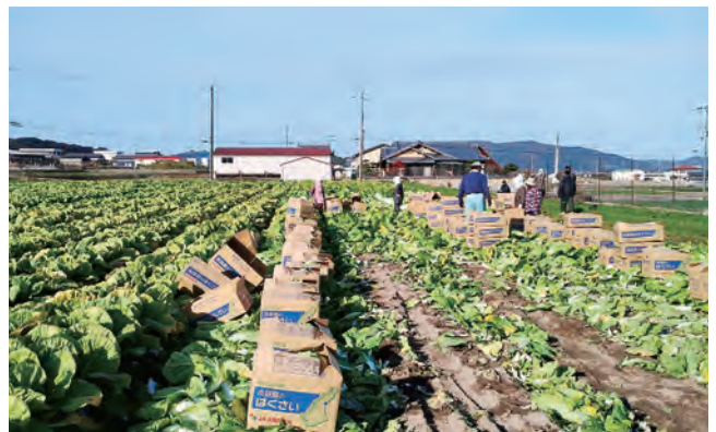
はくさいの収穫作業

洲本支店管内では、生産者から委託を受けたはくさいの収穫作業が12月17日から始まりました。今年度は適度な雨が降りましたが、気温が高かったため害虫の発生が多く、生産者は防除対策に苦労しました。収穫委託作業は、生産者の作業負担の軽減と市場への安定出荷につながり、面積拡大による農業収入の増加を目的としています。ほ場や天候をみながら生産者と話し合い、作業日程を決めています。収穫委託の申込は6件あり、240アールの面積を作業員10名程度で収穫と選果作業を行い、その日のうちに京阪神市場に出荷します。収穫作業は2月末まで行う予定です。