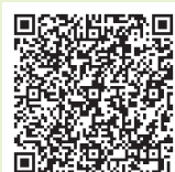
本についてはこちら