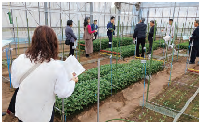
研究所で質問する部会員

あらせいとうの会は、10月30日から31日に千葉県館山市にあるストック先進地へ視察研修に行きました。初日は、神戸(かんべ)花卉生産組合のは場を見学しました。栽培省力化の一つである「直播」の技術について、現地の生産農家から説明を受けました。2日目は、千葉県農林総合研究センター暖地園芸研究所を見学し、直播栽培した場合の灌水量について、職員から講習を受けました。気温や灌水量によって、生育差が出ることが課題であるため、発芽の不揃いからの品質低下を防ぐための調査をしているとのことでした。部会員からは活発な質問があり、有意義な視察研修となりました。