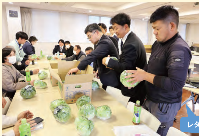
レタスを見比べる部会員

また、栽培作物のグループに分かれ、高品質で安定した出荷を目指して、座談会を開きました。他産地と同部会が出荷した野菜を見比べ、市場が求める出荷姿や状態について話し合い、栽培のヒントや注意点など様々な情報を共有しました。