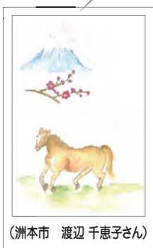
(洲本市 渡辺 千恵子さん)