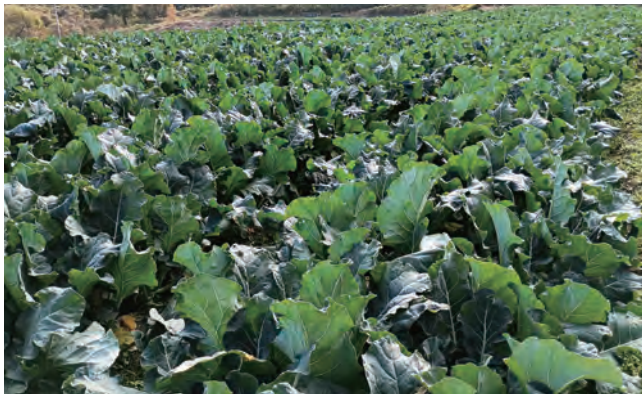
順調な生育のブロッコリー

北淡支店管内では、ブロッコリーの出荷が昨年12月から順調に行われています。生育はおおむね順調であり、雨不足や病害虫対策を徹底し、生産者は丹精を込めて収穫・出荷しています。ブロッコリーはタンパク質やビタミン、ミネラル、食物繊維をはじめ、さまざまな栄養素を多く含んでおり、食卓を彩るすばらしい緑黄色野菜です。