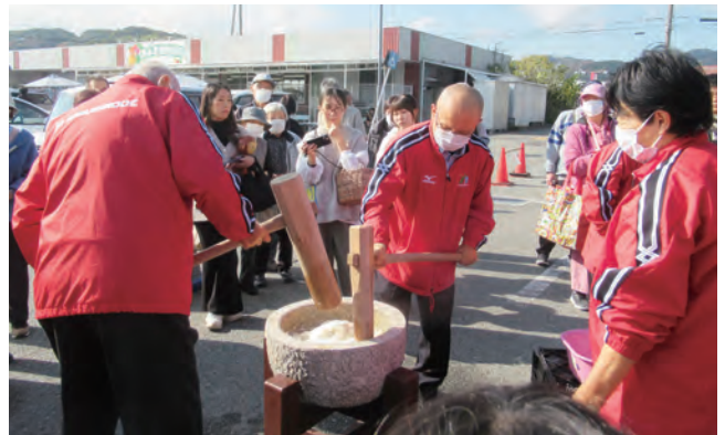
賑わうお餅つきコーナー

東浦淡路支店は11月30日、道の駅祭り「キッズあきんど」へ協賛し、支店感謝祭を行いました。お米の販売やサメ釣り、その他、お米すくいやお米の重さ当てなどを催しました。また、フローラルアイランドと協力してお餅つきを行い、ぜんざいのふるまいには400食分を用意していましたが、すぐなくなるほど大好評でした。お餅つきの体験コーナーを設けると、初めて体験した子どもたちからは「楽しかった」「杵が重かった」などの声があがりました。