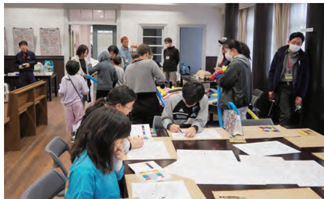
楽しくぬり絵に取り組む児童たち

淡路獣医師会は、動物愛護フェアのイベントを11月9日、「淡路ファームパークイングランドの丘」で淡路在住者無料開放デーに合わせて行い、146人が来場しました。当JAの獣医資格を持つ職員が同会に加入し、活動をともにしています。イベントでは、但馬牛や神戸ビーフの紹介、さらに獣医師の仕事に関してパネル展示をしました。年少児童向けにバルーンアートやぬり絵体験を用意し、楽しんでもらいました。ペットの飼い方相談会や災害時のペット対応についての動画放映なども行い、賑わいのあるイベントになりました。