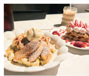
お気に入りの 「ワッフルケーキ」