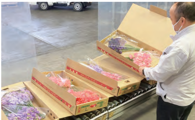
スイートピーを検品するJA職員

津名支店管内では、生産者が真心を込めて育てたスイートピーの出荷が11月中旬から始まりました。出荷は4月上旬頃まで続きます。今年度は生育期間に気温が高い日が続いたため、栽培管理に手間がかかりましたが、日々の徹底した手入れにより、現在の良好な出荷状況につながっています。需要が高まる時期は、成人式・フラワーバレンタイン・卒業入学等のイベントシーズンです。今後も品質向上に尽力し、市場との連携を密に取りながら、美しい花をより多くの方へお届けしてまいります。