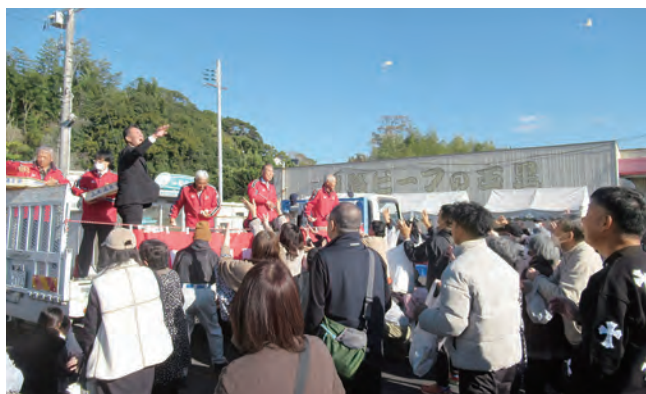
大盛況だったもちまき

五色支店は11月29日、日頃の感謝を込めて、毎年恒例の支店感謝祭を開催しました。天候に恵まれ、たくさんの方々が来場し、射的やスーパーボールすくいなどの遊技コーナーをはじめ、模擬店コーナー、キッチンカーなど各ブースとともに賑わいました。また、地元の新鮮な野菜の販売や新米の販売なども行いました。「淡路ビーフの試食」や「もちまき」のふるまいの時間には、特にたくさんの人が集まり大盛況でした。今後も地域の皆さまに食と農業を通じてJAを身近に感じていただけるよう、JAと地域の皆さまとつながりを持つ機会を増やしていける企画を実施してまいります。