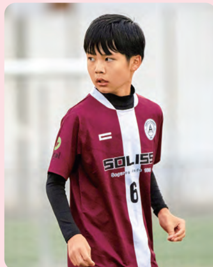
遠征のユニフォームを着て