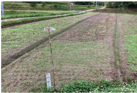
鎮圧区 (手前) と無処理区 (奥)

まず、収量を増加させる方法について3つ紹介します。一つ目は、排水対策です。牧草は湿害に弱いものが多いので、排水性の良好なほ場を選定しましょう。そして、播種前に溝掘り機などで、ほ場の周りに溝を切り、すみやかに排水するようにします。二つ目は、適期播種です。牧草は品種によって、適切な播種時期があります。播種が早すぎると、発芽不良や霜害により収量低下を引き起こします。また、播種が遅すぎると、病気の多発や生育が未熟な状態での出穂につながります。播種前に、栽培予定の牧草の播種適期を確認しましょう。三つ目は播種後の鎮圧です。播種後の鎮圧の有無は発芽率に影響を及ぼします。鎮圧すること、発芽率の向上に加えて、野鳥の食害防止や雑草の発生も抑制することができます。鎮圧機をお持ちでない方は、ぜひ導入をご検討ください。