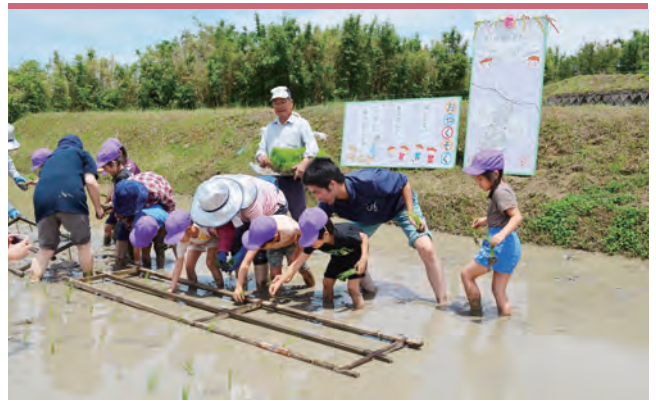
園児と田植えをする入野地区のみなさん

淡路市入野地区の農業従事者によるボランティア団体は、6月9日に神戸市のFIGO保育園から園児19名を招待し、田植え体験を開催しました。自然豊かな場所で田植え体験をできたということで、園児たちは泥まみれになりながら元気いっぱい苗を植えました。秋には稲刈り体験とさつまいも掘りを予定しており、園児も心待ちにしている様子でした。