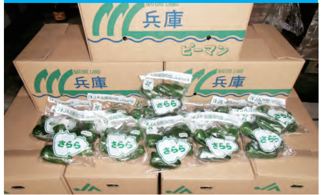
人気の「さらら」ピーマン

洲本支店管内では、6月9日からピーマンの出荷が始まりました。今年は寒暖の差が激しく曇天も多かったことで、生育は少し遅れた状況となっています。栽培品種の「さらら」は緑色が濃く、果肉が柔らかく苦味が少ないのが特徴で、市場からの評価は高いです。ピーマンは夏から秋にかけて当JAの主力野菜として栽培され、生産者は11月頃までの長期間に渡り、栽培管理・収穫・選別・箱詰作業に励みます。