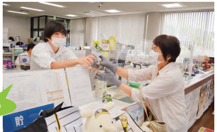
花苗をプレゼント(五色支店)

当JAの各支店では、お客様が楽しめる支店づくりとして、感謝デーなどのイベントを実施しています。五色支店では6月15日、マリーゴールドの花苗をプレゼントしました。花言葉は「健康」。みなさんの健康を願う気持ちを込めて贈りました。