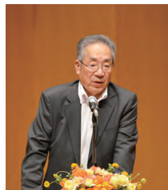
あいさつする相坂組合長