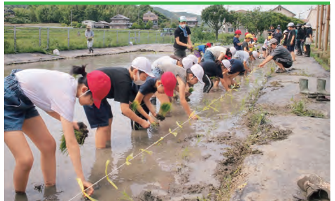
田植えをする小学生

淡路市立浦小学校では6月16日、5年生29人が小学校横の田んぼで田植え体験教室を行いました。講師を務めた地元の農家の方から、植える苗の本数や苗の深さなど作業手順の説明を受け、先生・JA職員が見守る中、田んぼの中に入り、目印のロープに沿って田植えをしました。日頃、なかなか泥んこになることもないので、はしゃぐ生徒もいました。生徒は「苗の高さを調整するのが難しかった」「口の中に土が入って気持ち悪かったけど楽しかった」と話していました。終了後には、農家の方から「今日の田植えの楽しかった思い出を忘れないように」と話がありました。