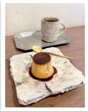
至福のカフェタイム