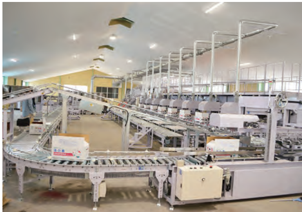
たまねぎ共同撰果施設

新型コロナウイルス感染が収まらない中、食肉価格の回復が遅れ和子牛価格も低迷が続きました。更に、穀物相場高騰で未曾有の飼料価格高騰が畜産経営を圧迫し、生産基盤にも大きな打撃となりました。