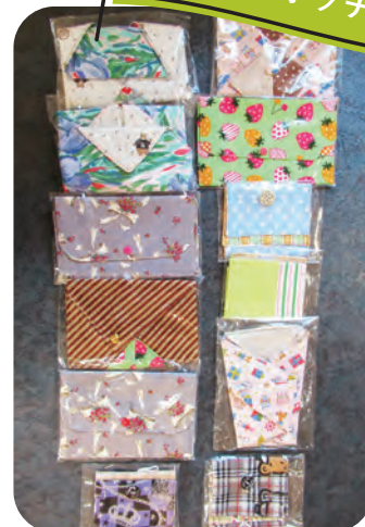
余った布で作った小物類