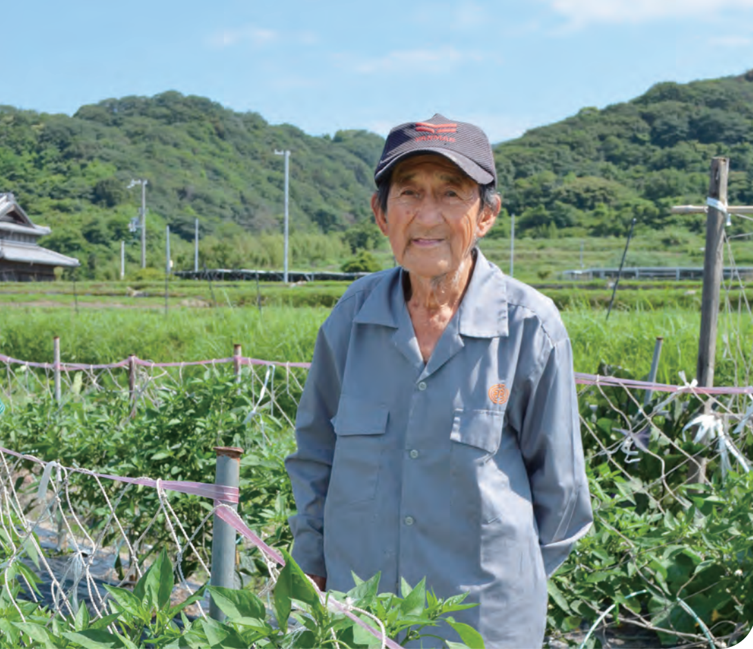
シシトウのほ場で

北淡支店管内で、行われているシシトウ栽培。6月下旬から始まる出荷は、10月まで続きます。品種改良され、苦いのは少なく、美味しくいただくことができます。