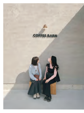
友人とカフェめぐり

共済課窓口3年目です。主に自動車共済を担当していますが、生命共済などの知識を身に付けていきたいと思っています。 趣味は旅行です。休日は友人とカフェへ行ったりします。組合員・利用者みなさまに満足して頂ける窓口対応を出来るように頑張っていますので、よろしくお願いします。