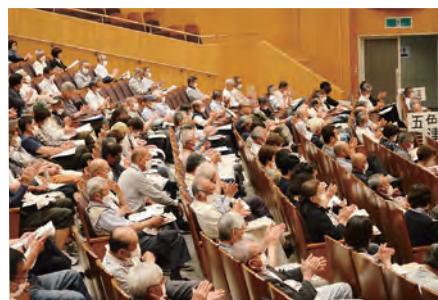
拍手で賛成する総代のみなさん