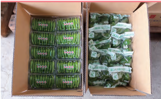
出荷されたししとう・ピーマン

北淡支店管内では、旬の味覚のししとう・ピーマンが11月頃まで市場へ出荷されます。すでに6月から収穫が始まっている夏の野菜（ししとう・ピーマン）は根が細かいので、暑い夏場は、かん水や施肥のきめ細やかな栽培管理が不可欠です。他の作物と比べ経費が比較的少なく、とても栄養（ビタミンC・カロチンが多く含まれる）があり、作業負担の少ない軽量野菜で、和食・洋食・中華など、どんな料理にも合う便利な野菜です。