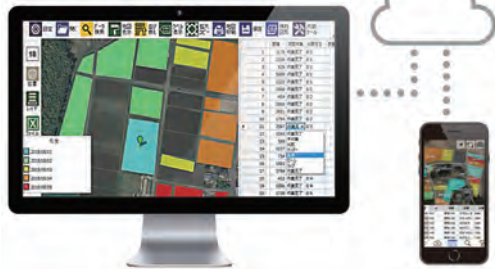
稲作新技術の実証 (スマート農業) 稲作新技術 地図情報システム Z-GIS

そして、経営理念に基づき、環境に対応し、改革を実行できる人材の育成と協同組合運動を推進できる人づくりに取り組めます。さらに、職員の意欲と能力を活かす「活力ある職場づくり」に取り組めます。