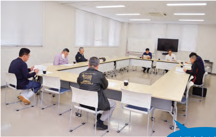
審議をする参加者

同研究会は、衛生・防疫対策の徹底強化、環境美化・暑熱対策に万全を期した安全で安心な美味しい肉づくりを目指します。また、交流と研鑽を重ね、より高品質な牛肉生産に向けた肥育技術の向上と経営安定化を図ります。