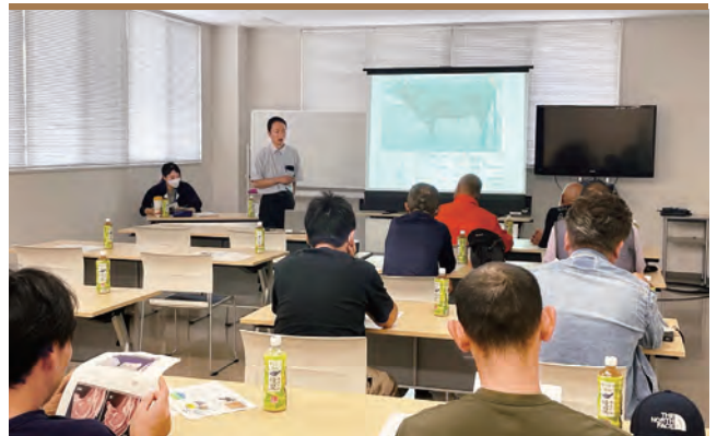
講演を受ける参加者

北淡路農業改良普及センター主催の但馬牛生産向上研修会が6月9日、淡路和牛青年会・あわじ和牛倶楽部・新規就農繁殖農家のメンバー12人が参加しJA本店で開催されました。