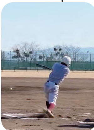
ナイスバッティング

小さい頃、兄の野球姿を見て小学2年生から始めた野球。学校や家庭では学べないことを野球を通して学び、成長することができました。練習が終わってからも納得がいくまで友と自主練習しています。何事にも感謝の気持ちを忘れず、一日一日を大事に過ごしていきたいです。チームメイトと一致団結し、勝利をめざしたいです。津名高等学校野球部、応援よろしくお願いします。