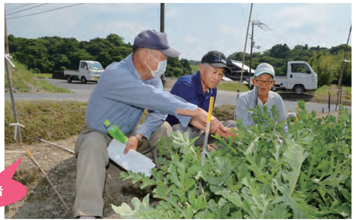
生育状況を見る生産者

種苗会社の技術者は、「天候に気をつけながら人工交配に取り組み、1株当たり3〜4玉の着果を目標に高品質で大玉のすいかを生産しよう」と呼び掛けました。生産者は管理方法や病害等について熱心に質問をしていました。