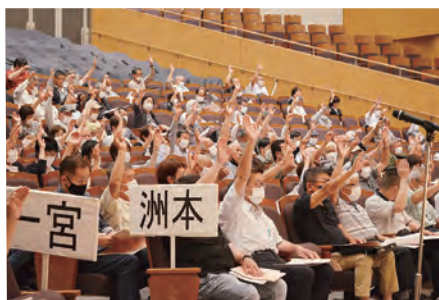
挙手する総代のみなさん