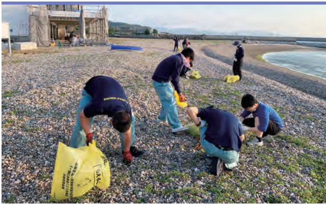
新五色浜を清掃する職員

五色支店では6月20日、地域密着型支店づくりの一環として新五色浜の清掃作業を行いました。当日は天候に恵まれ、役員職員は丸となり砂浜に漂着したゴミ拾いや草刈りを行いました。約1時間の清掃はあっという間でしたが、皆様が気持ちよく利用できるように海岸の美化に努めました。