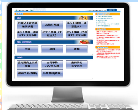
パソコン画面イメージ