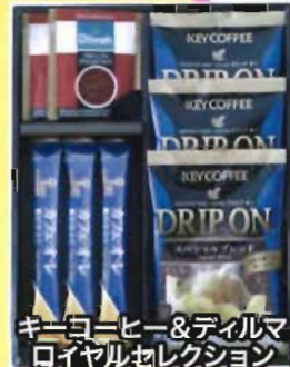
キーヨニヒー&ディルマ ロイヤルセレクション