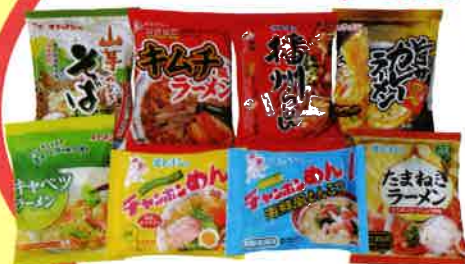
イトメン 味わいセット