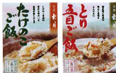
雲月 炊き込みご飯セット