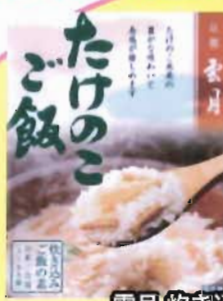
雲月 炊き込みご飯セット