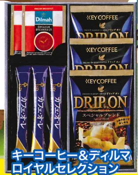
キーコーヒー&ティールマ ロイヤルセレクション